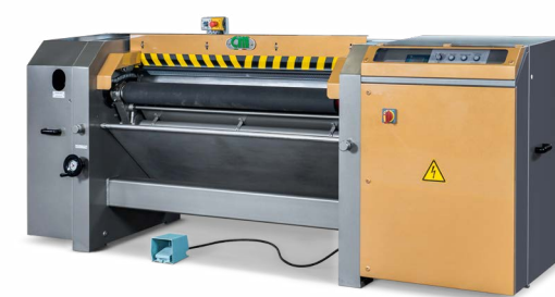
MACCHINA A SCARNARE